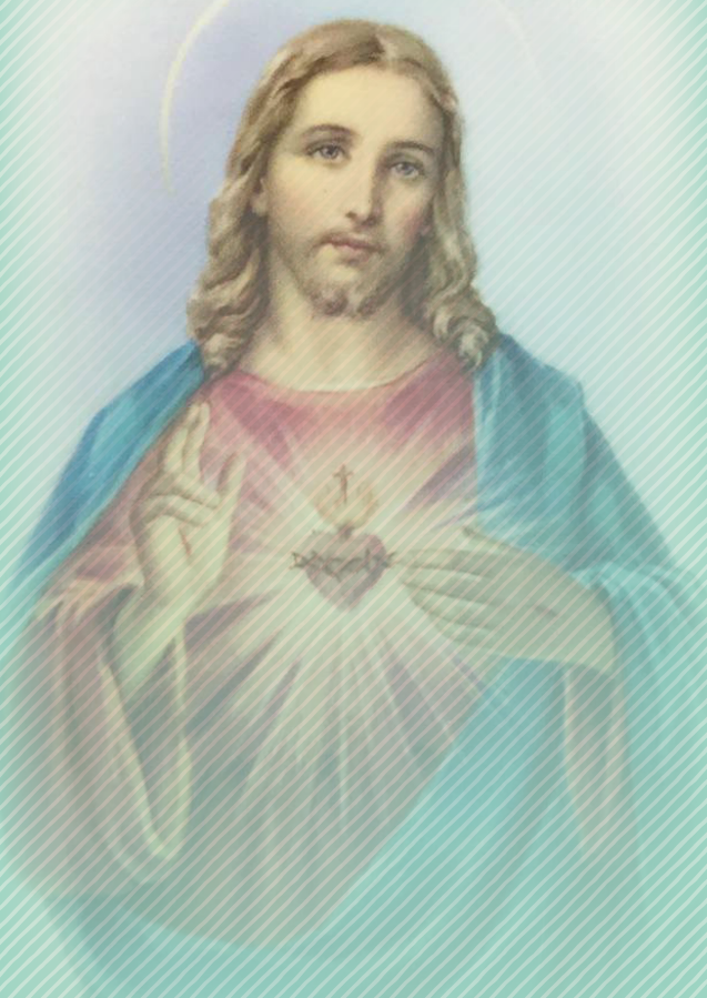
Qalb ta' Ġesu' Jiena Nafda Fik

Lil Ġesu' nkun qed inħobbu meta nuri rispettt lejn il-ġenituri, l-għalliema u dawk li jieħdu ħsiebi. Lil Ġesu' nkun qed inħobbu meta ngib ruħi sew kull fejn inkun u ngħin lil shabi anke jekk ma tantx naqbel magħhom. Lil Ġesu' nkun qed inħobbu meta ma nweggħax lil ħaddieħor bi kliemi. Jekk nibda b'dawn l-affarijiet zgħar ta' kuljum, inkun qed nagħmel il-ħajja tiegħi u ta' dawk ta' madwari ħafna isbaħ. Għalhekk kull meta nsib ruħi f'diffikulta' biex ngħix kif jixtieqni Ġesu', niftakar ngħidlu din it-talba zghira: 'Qalb ta' Ġesu', Jiena Nafda Fik.'